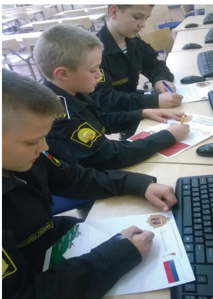
Рис. 1. Работа над проектом

Современное общество заинтересовано в том, чтобы его граждане были способны самостоятельно, активно действовать, принимать решения, гибко адаптироваться к изменяющимся условиям жизни. И это задача не столько содержания образования, сколько используемых технологий обучения, к которым и относится метод проектов.