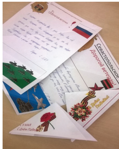
Рис. 2. Письма ветеранам

важности конечного продукта, осознание значимости сохранения в памяти подвига защитников отечества и сопричастности к истории России, рефлексия, анализ выполненной работы, её оценивание.