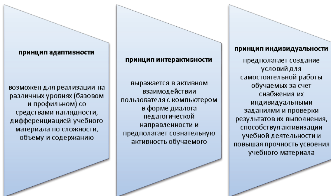
Рис. 1. Диаграмма «Дидактические принципы обучения с ИКТ»

Исследователи в области реализации педагогических технологий с помощью ИКТ выделяют три дидактических принципа обучения.