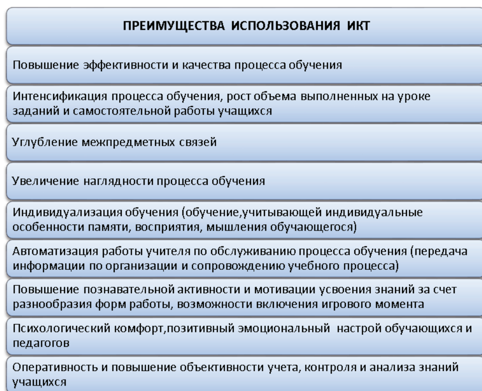
Рис. 3. Преимущества использования ИКТ на уроках и во внеурочной деятельности