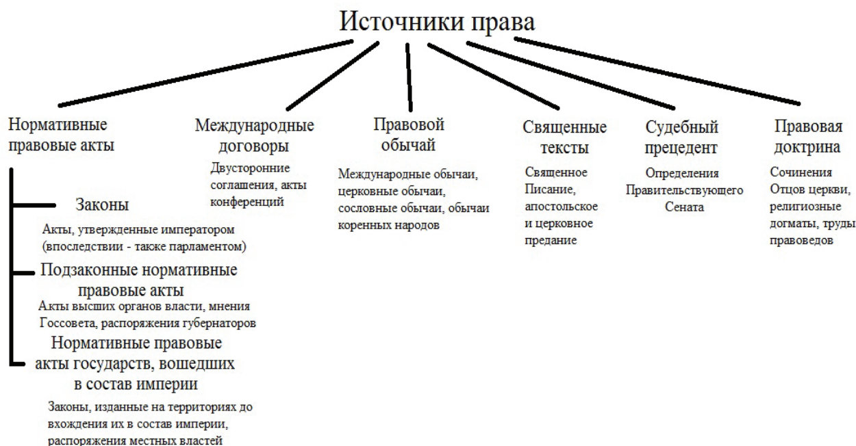
Рис. 1. Система источников права Российской империи на рубеже XIX–XX вв.

ст. 79]), правовые акты местных властей (распоряжения губернаторов [1, ст. 71] и, отчасти, законы, изданные на отдельных территориях до присоединения их к империи [1, ст. 71]), правовые обычаи [2, с. 224], нормативные договоры (в форме международных договоров) [2, с. 211], религиозные тексты (Закон Божий, апостольское и церковное предание) [3, ст. 6], правовая доктрина (в форме религиозных догматов, сочинений отцов церкви) [2, с. 195–201], судебный прецедент [2, с. 121]. Таким образом, источники права могли быть порождением императорской воли, в том числе выраженной иными представителями власти, общественной воли, совместной воли императора и глав других государств или божественной воли, в том числе выраженной религиозными деятелями православной церкви.