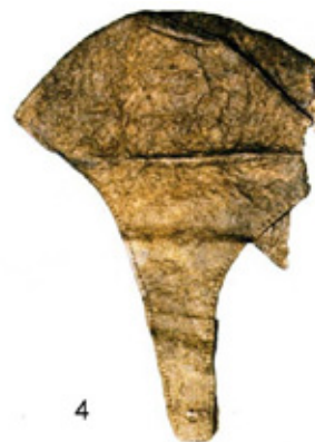
Рис. 4. Войлочный головной убор. Курган I, могильник Верх-Кальджин II. МА ИАЭТ СО РАН [10, стр.88, рис. 2.59 б]

Тип представлен находками уборов в курганах: третьем пазырыцком [10, с. 89, рис. 2.59 а], первом Верх-Кальджина II [10, с. 88, рис. 2.59 б.], Уландрык I [14, рис. 46.] (см. рис. 4).