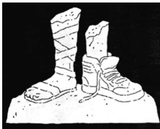
Рис. 3. Иллюстрация Т. Лэна к ст. «Опасность жизни ради хлеба и зрелищ»

Распространено мнение, согласно которому комическое отличается от элементарно-смешного именно своей социально-критической направленностью. В этом отношении комическое всегда социально окрашено. Комизм имперской теме Рима придает сам утопический характер импер-