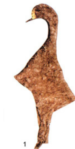
Рис. 1. Войлочный головной убор кургана I могильника Верх-Кальджин II, мужское погребение [8, рис. 1]

Аналогичные убора встречаются в могильнике Уури, Синьцзян [9, рис. 3.], на скульптурке юноши из Халчаяна