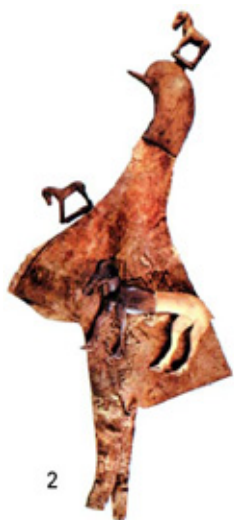
Рис. 2. Войлочный головной убор из кургана I могильника Ак-Алаха II [10, с. 87, рис. 2.58]

[1, илл. 56], и на изображениях скифов-стрелков на афинских вазах V — IV вв. до н.э. [13; 14, рис. 23]