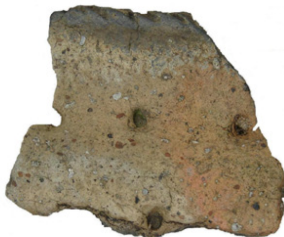
Рис. 2. Фрагмент верхней части керамического сосуда приказанской культуры (эпоха поздней бронзы). Красный Выселок

При осмотре поверхности разрушающихся Полянских стоянок — в 40 м к востоку от базы Юринского ремонтно-эксплуатационного участка «Инженерная защита Чебоксарской ГЭС» обнаружено тесло из светлого кремня. Лезвийная (рабочая) и обушковая части рубящего орудия отсутствуют (отбиты в древности?). Спинка и брюшко тесла обработаны широкой уплощающей ретушью. Орудие имеет линзовидное сечение.