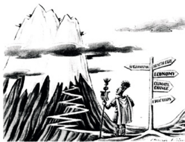
Рис. 4. Карикатура к ст. The Financial Times «Римская империя как пример самоограничения для Обамы»

Также многим представляются достаточно забавными проявления излишнего имперского рвения (если только это самое рвение не направлено на них). Действительно, можно утверждать, что ни одна страна не доминировала так, как США за всю историю со времен Римской империи в области культуры, экономики, технологий и военного дела. Вот только лозунг «Разделяй и властвуй» Imperium ROMAnum трансформировался в Imperium USAnum и звучит следующим образом: «Освободи и правь»...; а решение проблем самоограничения по примеру Рима (Рис. 4.) представляются американским экспертам неизбежным и жизненно необходимым.