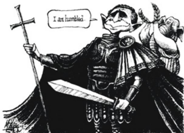
Рис. 2. Карикатура «Джордж Буш Младший – римский император»

кампании на периферии и продвигались внутрь, стремясь к богатым провинциям и центру.