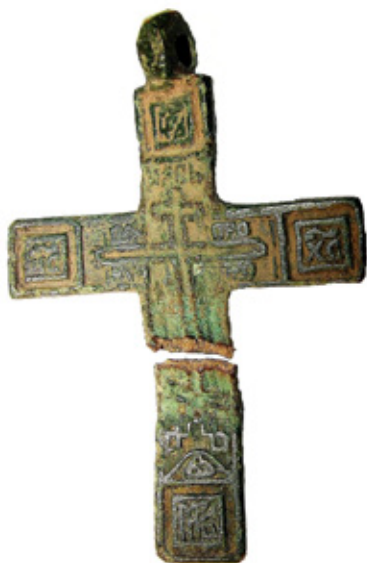
Рис. 1. Нательный крестик с опушки Бардицкого бора

ранилища позволило выявить в деревянном слое целый ряд объектов, связанных с хозяйственными постройками бывших крестьянских усадеб. Например, выявлены остатки столбовых ям. В центре несуществующего населённого пункта обнаружен разрушенный оползнем погреб. Стенки ямы, имевшей форму усеченного конуса, обложены половинками кирпича старой выделки.