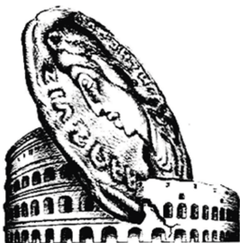
Рис. 1. Иллюстрация к ст. Дж. Р. Педена «Инфляция и падение Римской империи»

Вряд ли можно поспорить с утверждением, что «политическая история человечества по большей части — это история империй» [5, с. 3]. Настоящее время ознаменовано впечатляющим взлетом «имперских орлов»; причем, сегодня мы можем наблюдать не только очередной этап генезиса собственно имперской идеи. Генетически восходя к Риму, слово «империя» (как замечает С.В. Ткачев) входит в нашу обыденную жизнь в названиях развлекательных журналов, компаний, магазинов — и при этом предполагаются исключительно положительные коннотации этого слова. В общественно-политической публицистике «империя» — слово, звучащее уже постоянно; в качестве эпитета им «награждают» Россию, США и реже ЕС; в западной, и особенно американской, политологии проблематика империи переживает своего рода новое рождение.