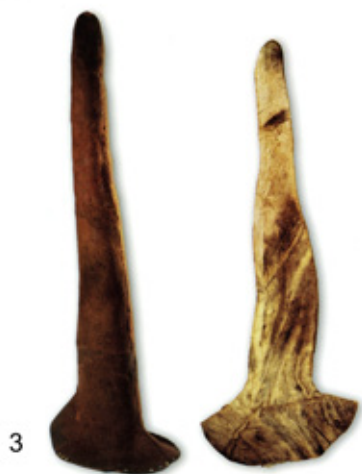
Рис. 3. Женские войлочные колпаки [10, с. 76, рис. 2.47 а, б]

Тип представлен находками головных уборов, в погребальных комплексах курганов №1 Ак-Алаха-3 и второго Пазырыцкого (см. рис. 3) [10, с. 76, рис. 2.47 а, б.; 3, с. 31–35].