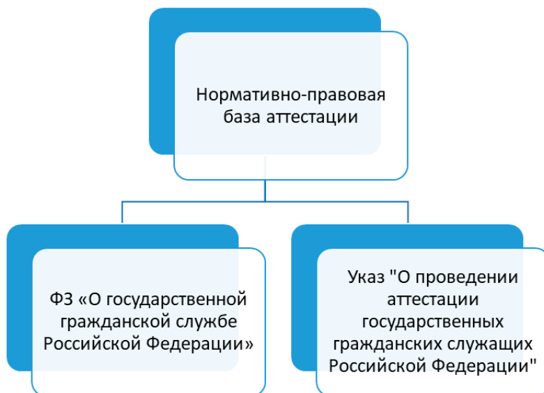
Рис. 1. Нормативно-правовая база аттестации государственных гражданских служащих

Аттестация гражданского служащего имеет своей целью определение соответствия гражданского служа-